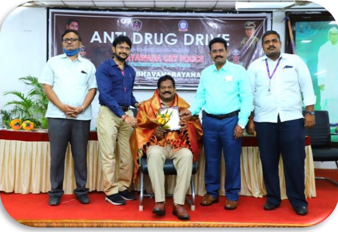
Felicitation to the Guests